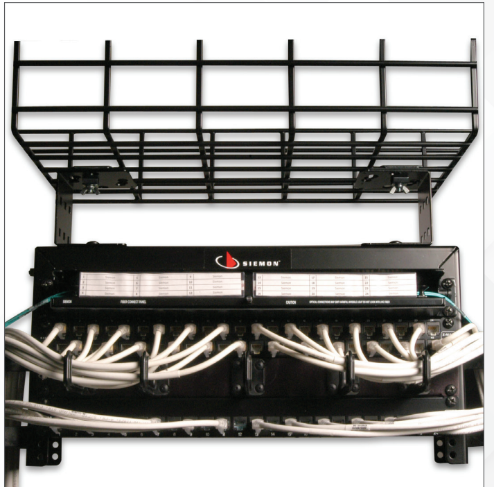
西蒙吊顶式桥架安装支架让 Wellstar 得以安装无法放入机柜的组件，支持与数据存储系统的连接。