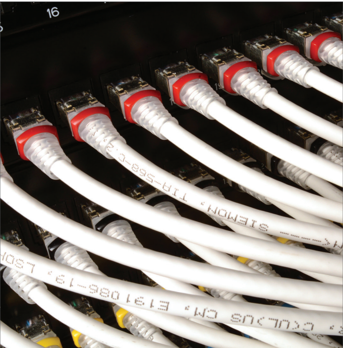
在 Wellstar 的高密度铜缆配线区内，SkinnyPatch® 模块化跳线改善了系统的可管理性、气流和灵活性。