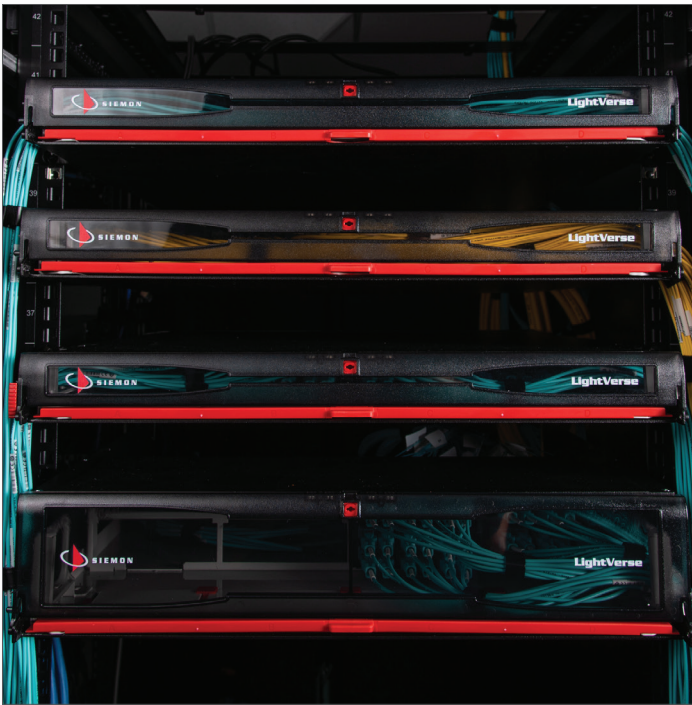
西蒙创新型 LightVerse® 高密度光纤布线系统让 Wellstar 得以在 1U 空间内将双工光纤端口从 72 芯扩展到 96 芯。