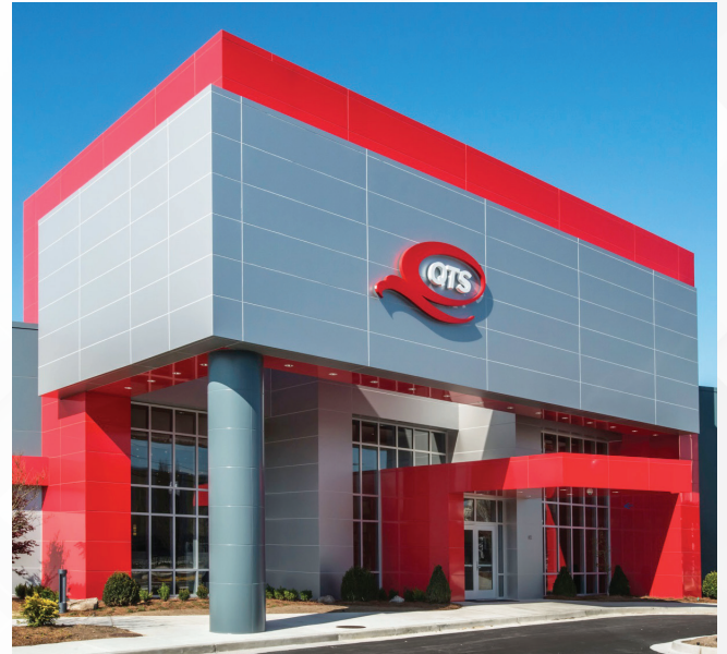
Wellstar 医疗系统公司将工作负载迁移到由 QTS 拥有和运营的两个不同的运营商中立托管数据中心，显著提升了安全性、合规性和可靠性。

他们没有升级和扩建现有的数据中心设施，而是决定将工作负载迁移到由 QTS（全称为“质量技术服务”公司 – 在北美和欧洲拥有超过 700 万平方英尺数据中心空间的行业领先提供商）拥有和运营的两个不同的运营商中立托管数据中心。其中一个托管数据中心已获得 LEED 金牌认证，是东南部最大的数据中心，拥有 970,000 平方英尺的空间，超过 275 兆瓦的计划总功率，还拥有自己的现场变电站，以及来自多个服务提供商的光纤接入服务。另一个托管数据中心可提供 385,000 平方英尺的空间和 26 兆瓦的总功率，还拥有多样化的供电方式和充足的扩建空间。